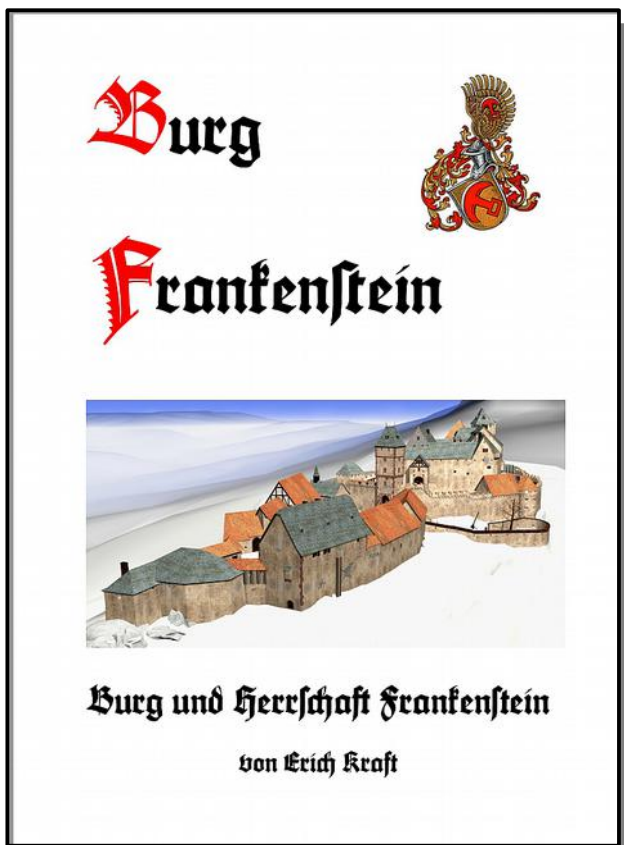
Din A 4, 28 Seiten 5.-