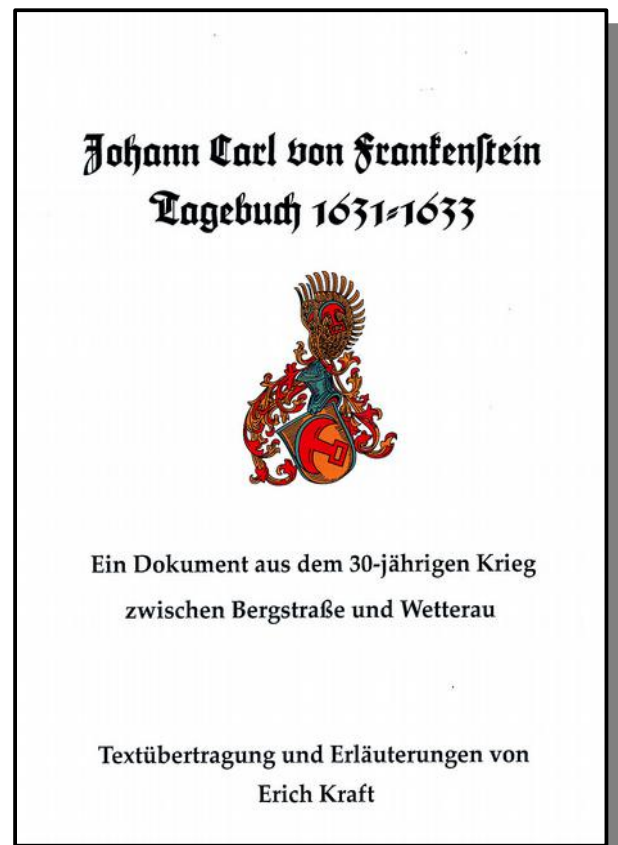
Din A 4, 48 Seiten 5.-