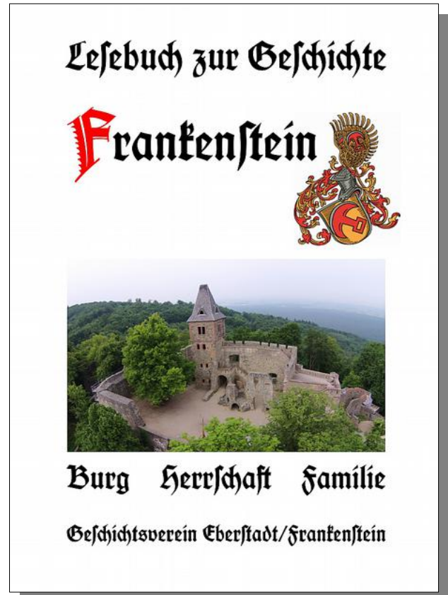
Din A 4, 220 Seiten 17.-