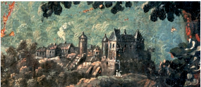
Auch im ältesten bekannten Bild der Burg wird Fantasie mit Wirklichkeit vermischt. Johann Tobias Sonntag 1747 (Schlossmuseum Darmstadt)

In das Reich der Sage gehören auch Geschichten um Ritter Arbo-gast von Frankenstein, der bereits 948 n.Chr. gelebt haben soll. Er ist die Erfindung eines Turnierbuchs des 16. Jahrhunderts.