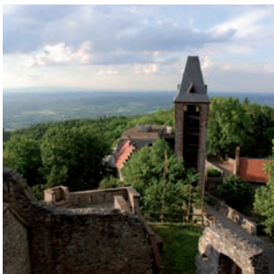
Blick von der Kernburg nach Norden

Die Kernburg ist der älteste Bereich der Burg. Teile von ihr stammen noch aus der Gründungszeit. Sie wurde von einem ca. 2 m starken, polygonalen Mantelring (1) eingefasst, an den sich dicht gedrängt Gebäude lehnten. Deren Bruchsteinmauern waren verputzt. Heute ist der hohe Mantelring nur noch an der West- und der Südseite sichtbar. 2008 wurden bei Grabungen im Rahmen von Mauerwerksinstandsetzungen Reste davon auch an der Ostflanke gefunden (2). Außerdem entdeckte man die Fundamente einer Pforte und der Innenbebauung. Auf der Nord-Westseite befindet sich der Schuttkegel eines weiteren Gebäudes (3). Sein Keller ist noch erhalten. Daran grenzen der alte Küchenbau (4) und der Palas (5) – das vornehmste Gebäude der Burg. An seiner Südseite steht ein Turm (6), in dessen Mauer der Leitspruch der Familie Frankenstein eingelassen ist: „Zu Gott steht meine Treue“.