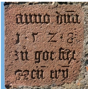
Stein mit Familienspruch