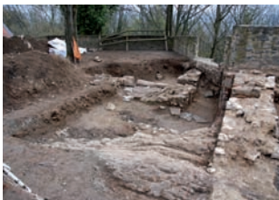
Ostseite Kernburg: Grabung 2008