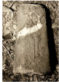
Oberteil des Steins (b)

Die Grenzsteine an der Nordwand der Burgkapelle (15) stammen aus dem Jahr 1556. Steine dieses Alters sind besonders selten. Sie sollten das Amt Seeheim, dessen Rechte die Grafen von Erbach inne hatten, von Frankensteiner Territorium trennen. Auf dem linken Stein (a) ist das Zeichen der Hippe (Rebmesser) zu erkennen. Es ist auch an der Nordwand des alten Seeheimer Rathauses zu sehen und bis heute Bestandteil des Seeheimer Wappens. Das Zeichen war ebenso dem verschollenen Oberteil des rechten Steines (b) eingeschlagen. Zum Schutz vor weiterer Zerstörung wurden beide Flurdenkmäler 2008 auf die Burg gebracht. Ursprünglich standen sie auf der Grenze der Gemeinden Seeheim-Jugenheim und Mühlthal (Gemarkungen Malchen und Nieder-Beerbach). Grenzsteine mit Frankensteiner Wappen wurden in Ockstadt, Frankfurt und Bürstadt gefunden - nahe der Burg aber nicht. Der Landgraf hatte sie wohl 1662 entfernen lassen.