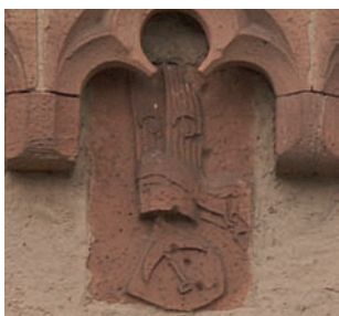
Wappentafel mit Fries