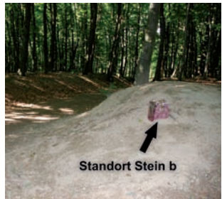
Standort Stein (b)