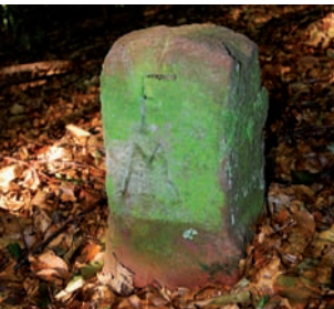
Standort Stein (a)