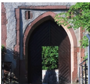
Toranlage des Torturmes